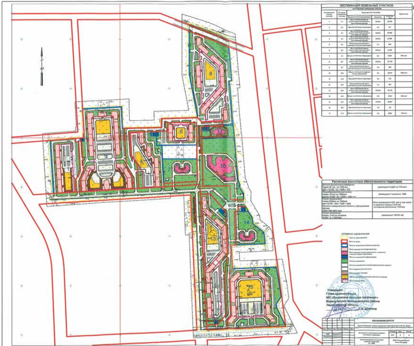
Схема планировочного решения развития территории М 1:2000

Приложение № 1 к постановлению администрации МО «Бугровское сельское поселение» Всеволожского муниципального района Ленинградской области от 27.12.2013 г. № 446