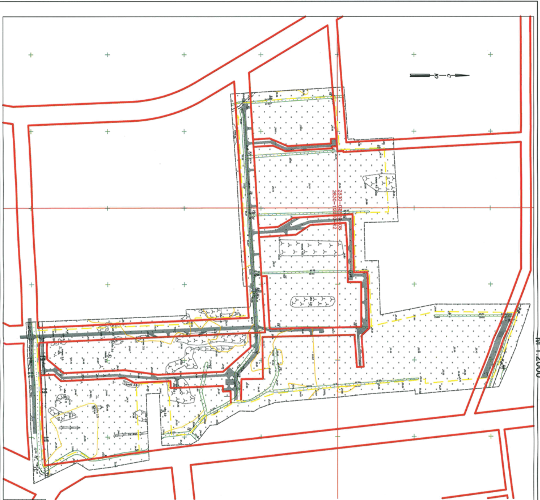
Чертеж красных линий и линий, обозначающих дороги, улицы, проезды, линии связи, объекты инженерной и транспортной инфраструктур М 1:2000

Приложение № 2 к постановлению администрации МО «Бугровское сельское поселение» Всеволожского муниципального района Ленинградской области от 01.10.2013г № 416