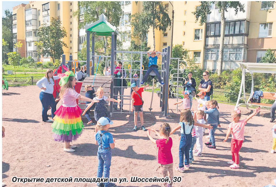
Открытие детской площадки на ул. Шоссейной, 30