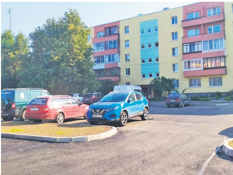
Комплексное благоустройство территории – переулок Клубный, 5