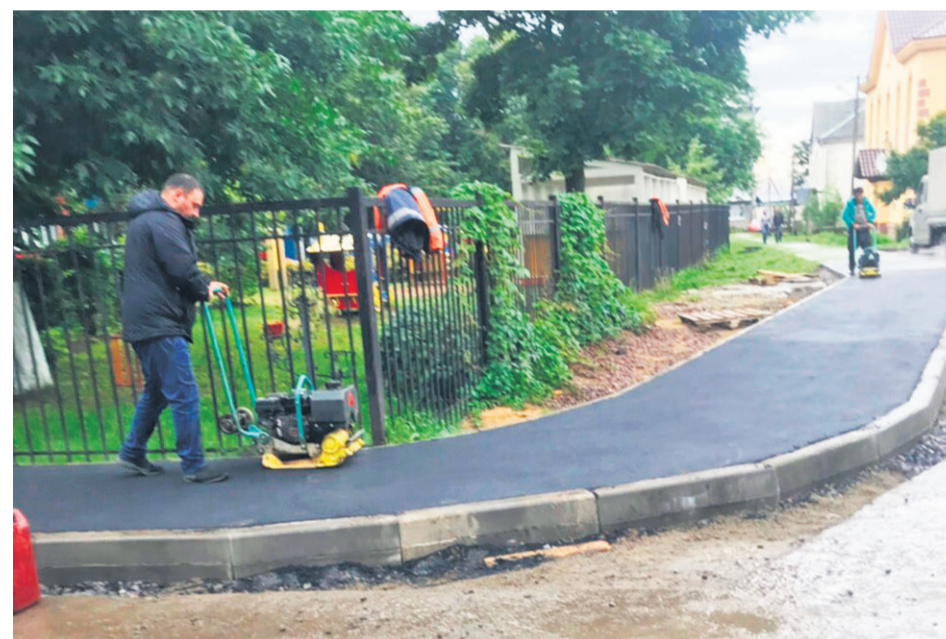
Благоустройство новой пешеходной дорожки возле детского сада

комплекс мероприятий по санитарному содержанию – 1 571 тыс. руб. (входит обслуживание экобоксов, акарицидная обработка, дератизация территории,