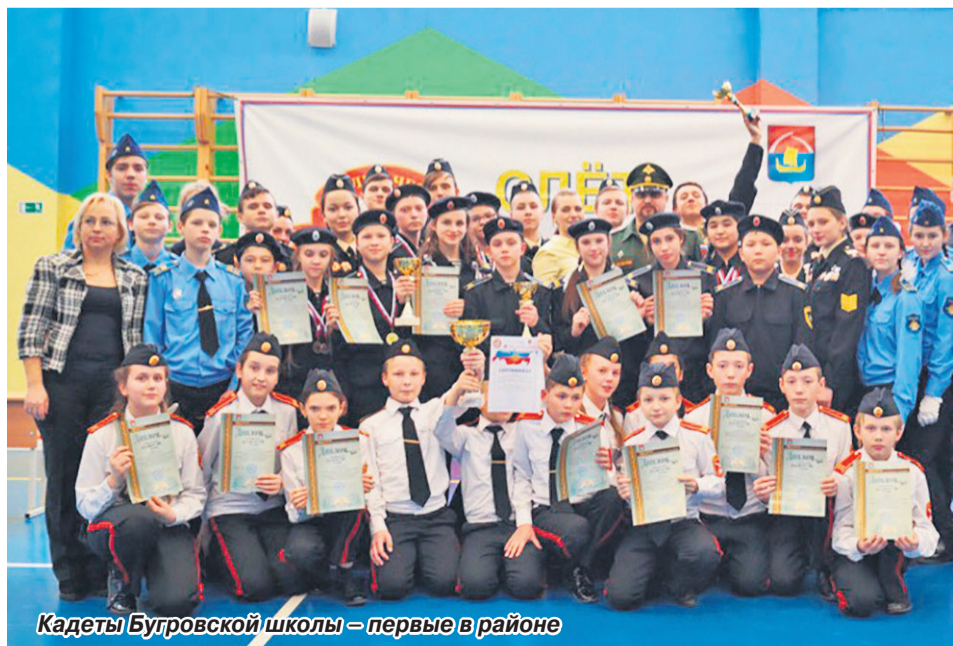
Кадеты Бугровской школы – первые в районе