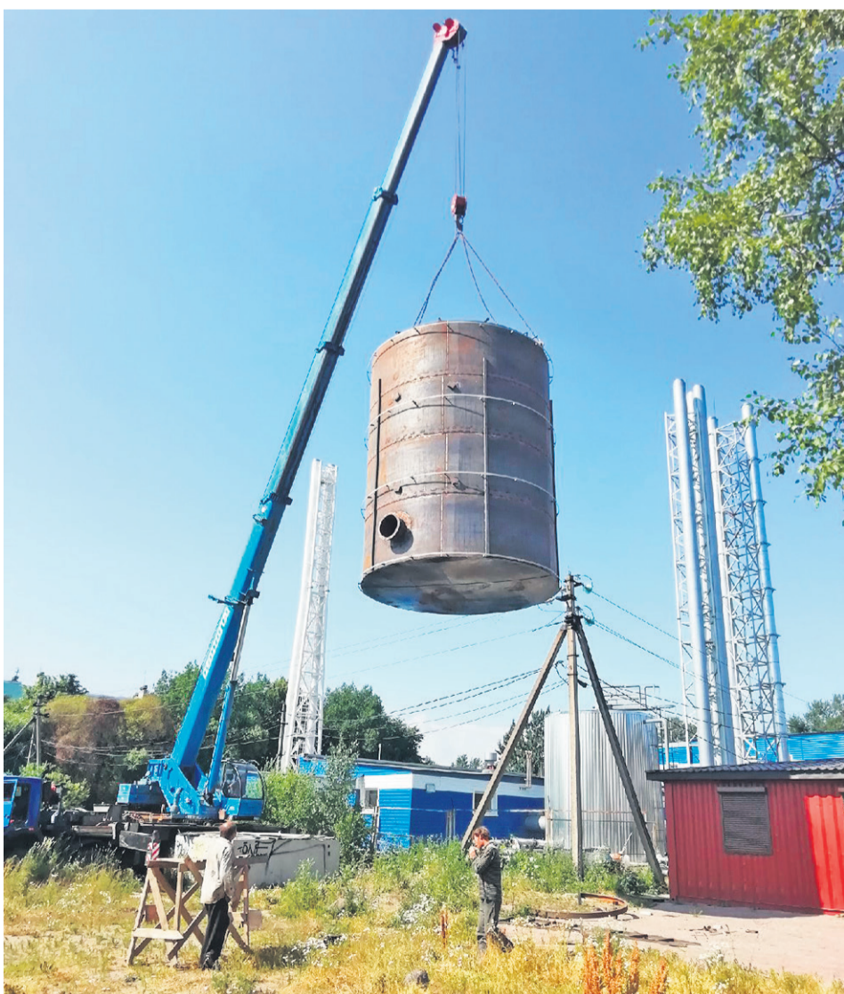
Установка бака-аккумулятора, котельная 29

- с организаций – 77 812 тыс. руб.; - с физических лиц – 43 670 тыс. руб., по сравнению с 2018 годом поступление налога увеличилось на 8,8%.