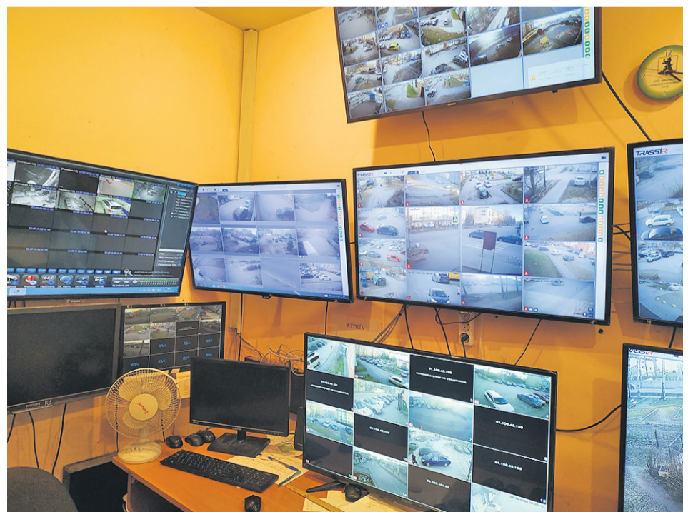
Дежурная диспетчерская служба. К мониторам подключены новые камеры

- произведено 43 выезда на место совершенных преступлений (тайное хищение имущества из квартир; угоны автотранспорта; избивание лиц, склонных к употреблению наркотических веществ, в сбыте наркотических веществ).