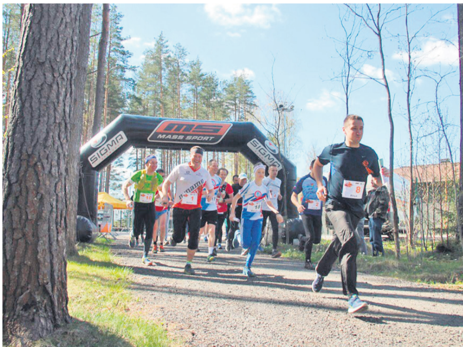
Забег с элементами ориентирования «Партизанскими тропами»