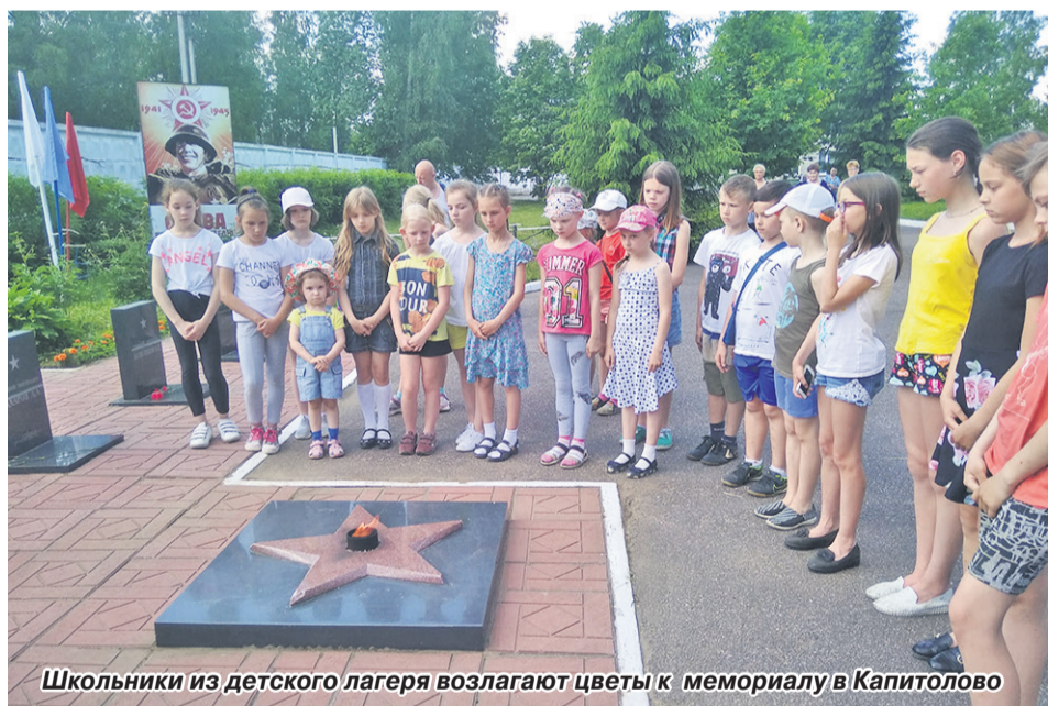
Школьники из детского лагеря возлагают цветы к мемориалу в Капитолово