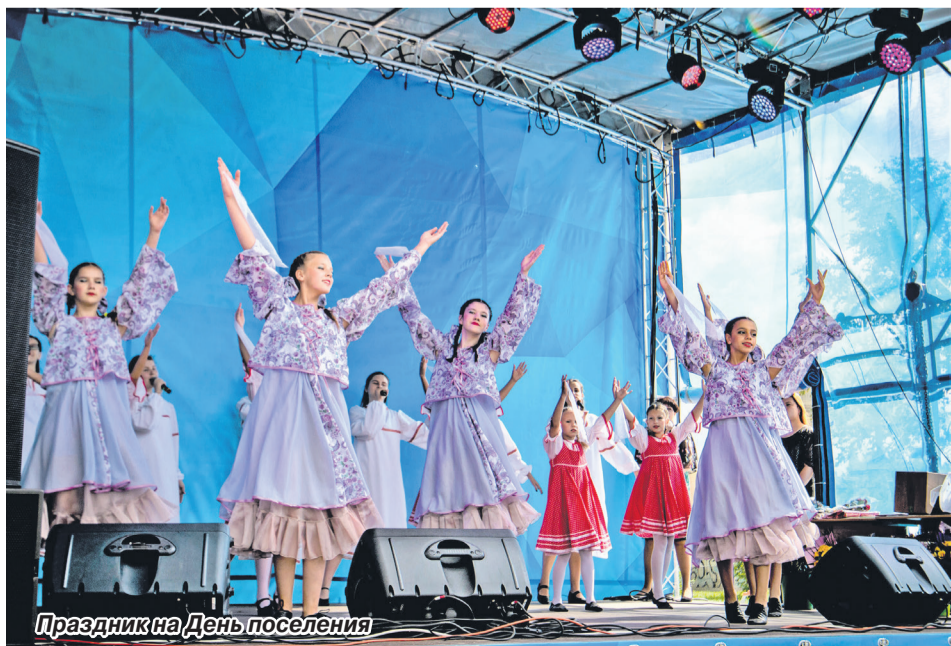
Праздник на День поселения