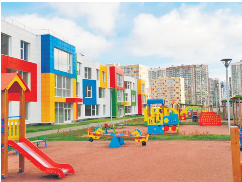
Новый детский сад на Воронцовском бульваре