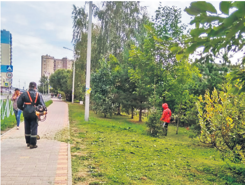
Покос травы на территории посёлка