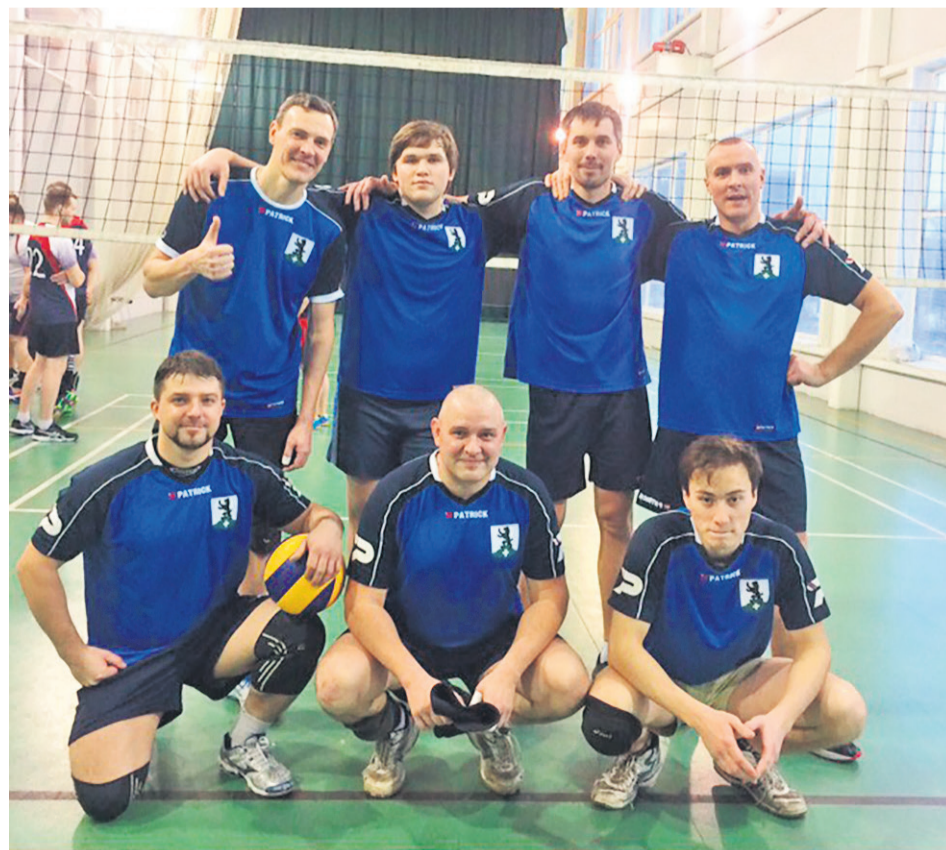
Бугровская волейбольная команда

Отлично зарекомендовавшие себя на различных площадках района воспитанники танцевальных и вокальных кружков, а также наши аниматоры, регулярно при-