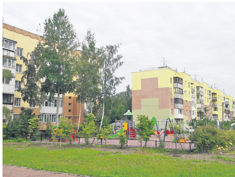
Новая детская площадка, ул. Шоссейная, 30

ского сада в пос. Бугры – 569,2 тыс. руб., - ремонт ТС и ГВС от жилого дома № 5 до жилого дома № 3 Клубного пер., пос. Бугры. Ремонт ТС и ГВС от ТК № 27 жилого дома № 5 Среднего пер., пос. Бугры. Ремонт транзитного трубопровода (ГВС) по адресу: пос. Бугры, ул. Шоссейная, дом 38 – 1 868 тыс. руб.,