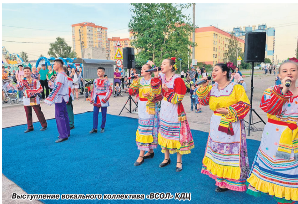
Выступление вокального коллектива «ВСОЛ» КДЦ