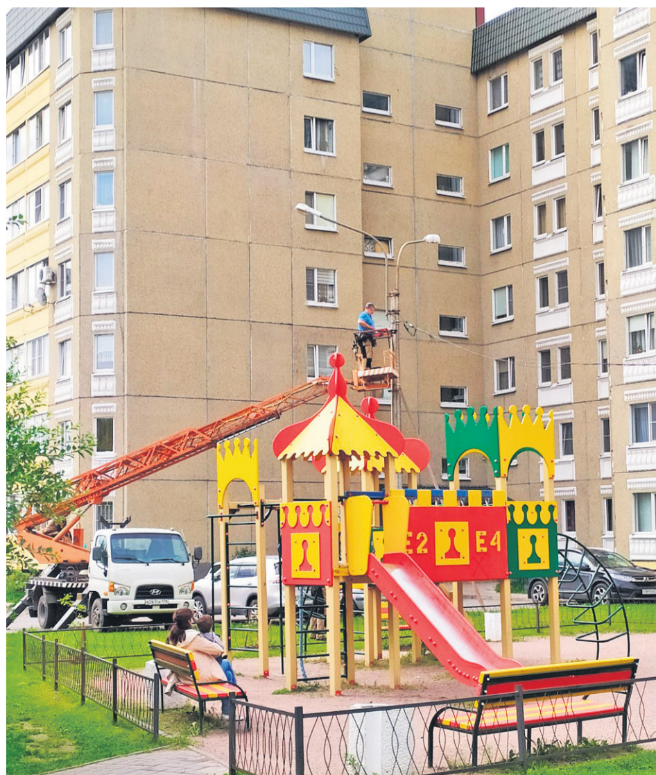
На Шоссейной, 38 меняют светильники и провода на СИПы