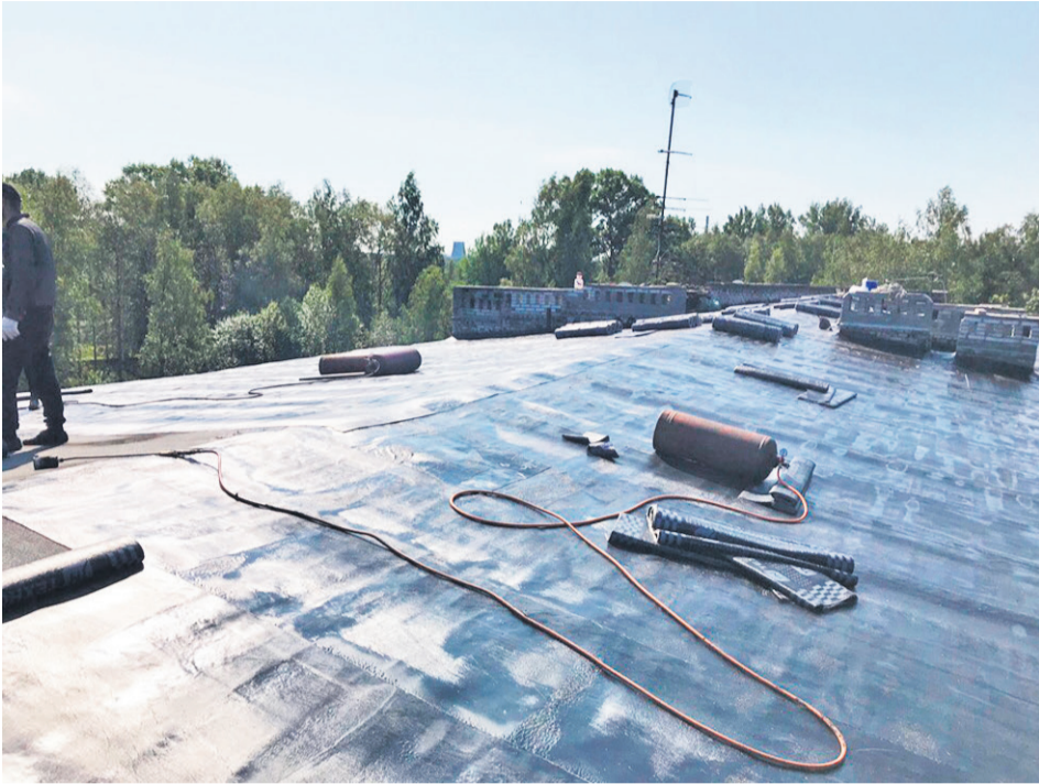
Капитолово, ремонт кровли домов на ул. Муравицкого