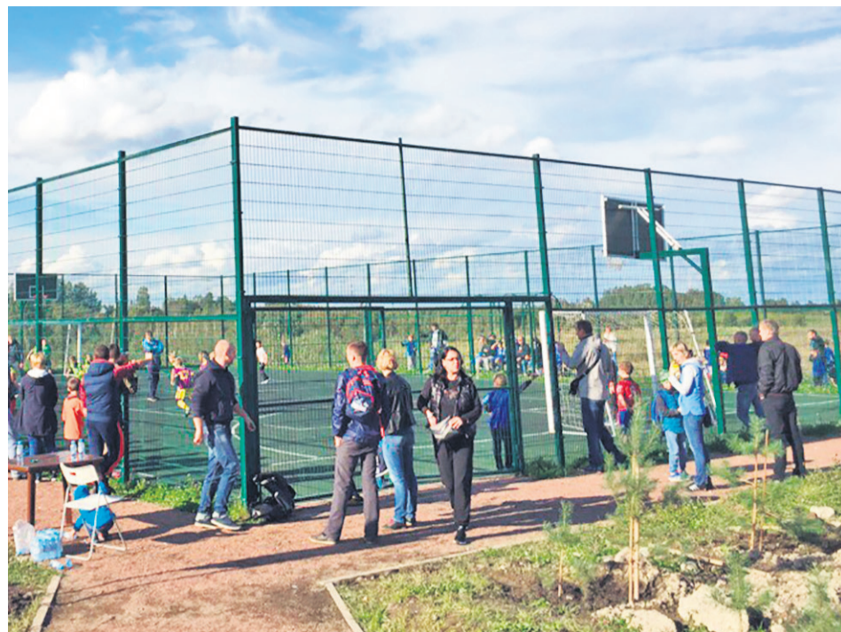
Спортивные соревнования на площадке в Порошкино

вырубка сухих деревьев и деревьев-взрос, чистка колодца),