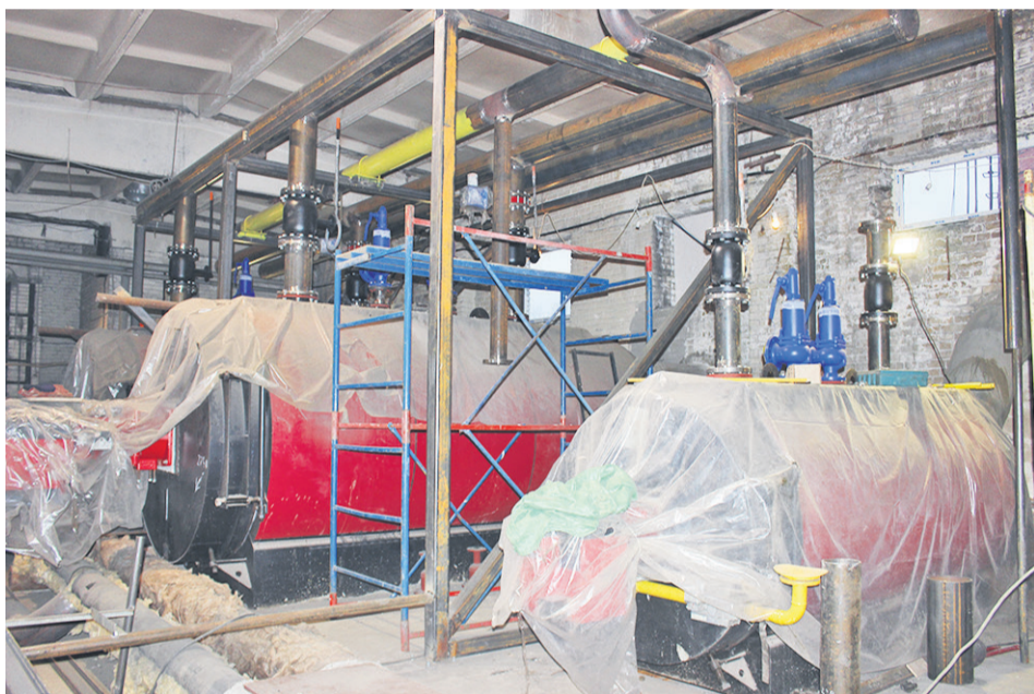
Новое оборудование на котельной 61