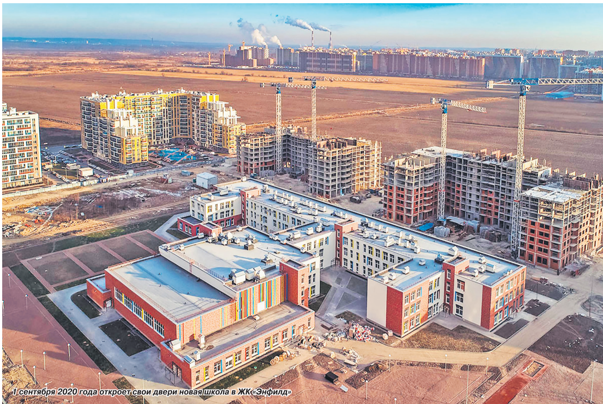
1 сентября 2020 года откроет свои двери новая школа в ЖК «Энфилд»