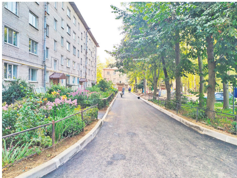
Комплексное благоустройство территории – ул. Шоссейная, 10