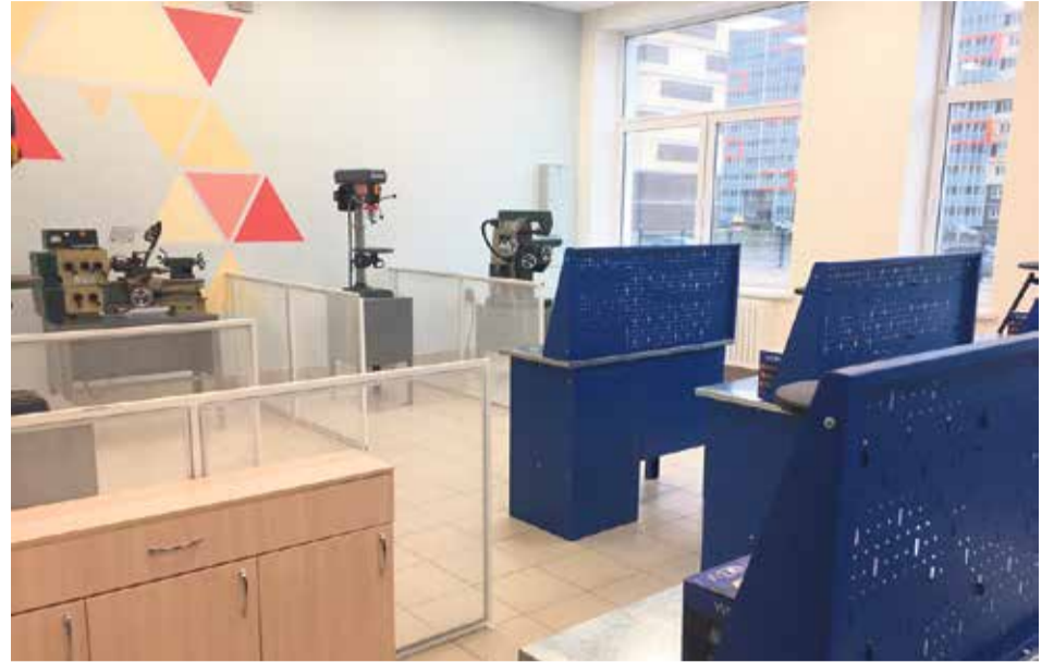
Кабинеты в новой школе

По программе «Стимул» в этом году строятся четыре детских сада и три школы. Также детские сады и школы строятся по региональной программе «Социальные объекты в обмен на налоги» и за счет бюджета района. Всего в 2020 году на территории Всеволожского района планируется открыть 10 детских садов и четыре школы.