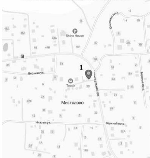
1 фрагмент Схемы размещения нестационарных торговых объектов на территории муниципального образования «Бугровское сельское поселение» Всеволожского муниципального района Ленинградской области

- места размещения нестационарных торговых объектов