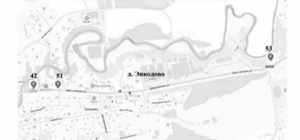
10 фрагмент Схемы размещения нестационарных торговых объектов на территории муниципального образования «Бугровское сельское поселение» Всеволожского муниципального района Ленинградской области